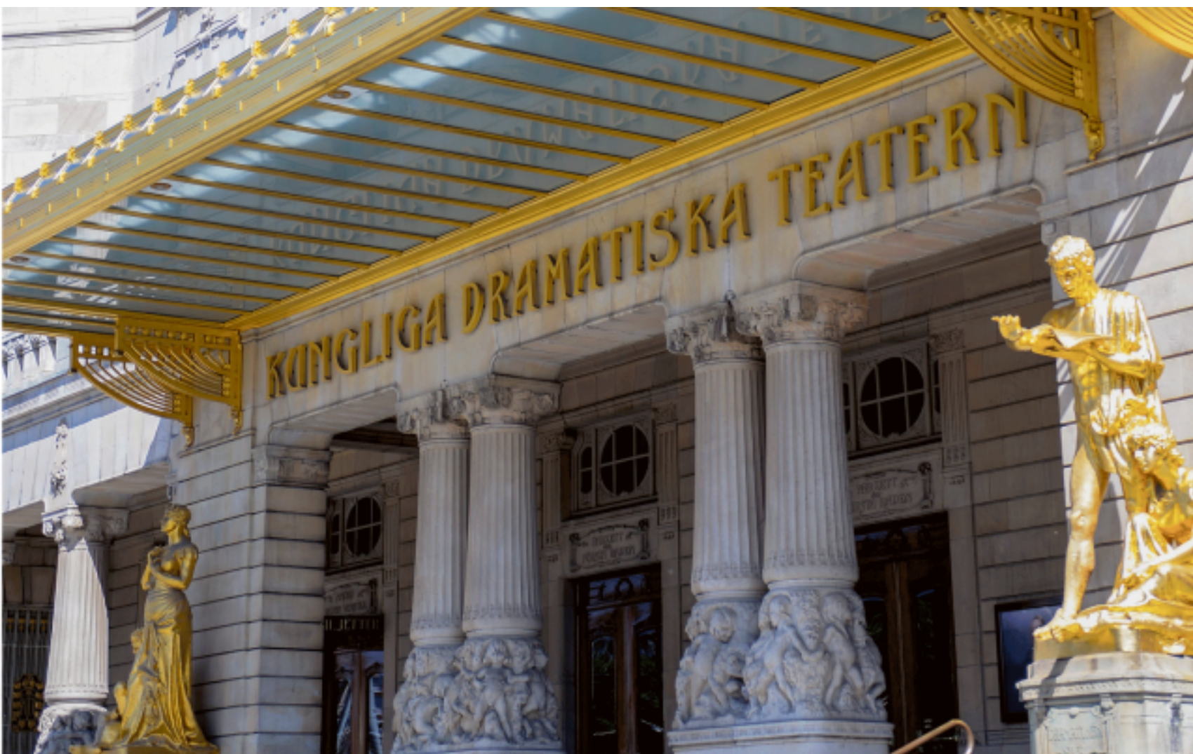
Dramaten i Stockholm.